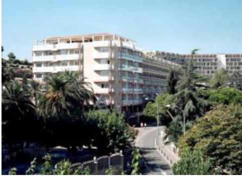
HOTEL GUITART CENTRAL PARK ***

Constante Ribadella, 7 17.310 Lloret de Mar (Girona)