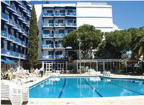
HOTEL DON JUAN ***

José de Tagores, 28 17310 Lloret de Mar (Girona)